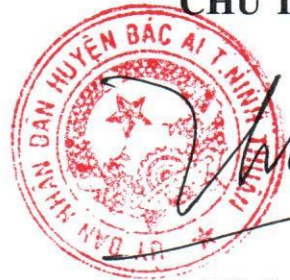
Phan Ninh Thuận